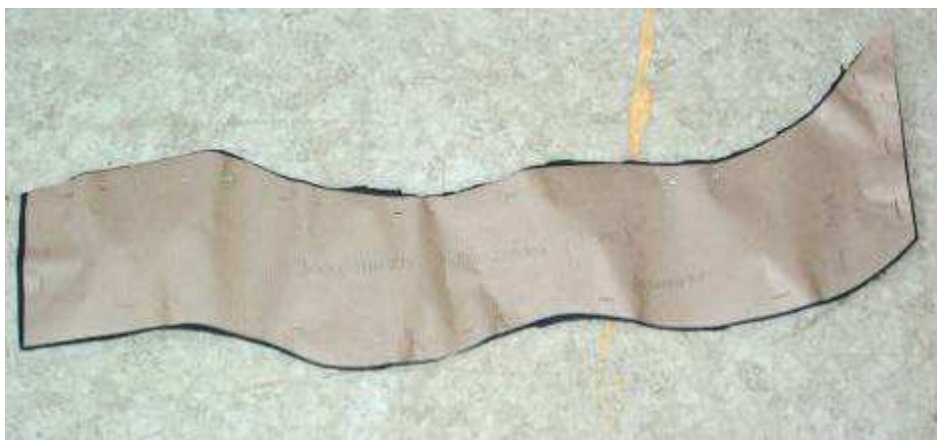
d'Horizontal Badgestreifen am Feutre sin herausgeschnidden